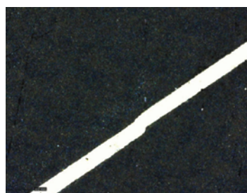
従来システムでの加工結果 (分割したエリアのつなぎ目)