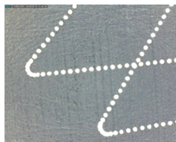
SDC 機能がないときの加工結果 (ガルバノが減速するコーナー部分に パルスが溜まってしまう)

SCANLAB 最新の機能であるスポット間隔制御 (SDC) 機能を搭載しており、スキャンパターンに関係なく一定のパルス間隔を維持した加工が可能です。それにより、加工の直線部だけでなく、書き始めや書き終わりの加減速部やコーナー部でも均一な加工が可能です。その結果、加工結果の加工のムラを最小限に抑えることが可能です。