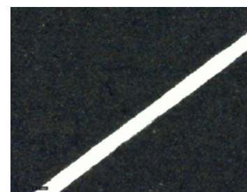
XL SCAN での加工結果 (つなぎ目なしのシームレス加工)