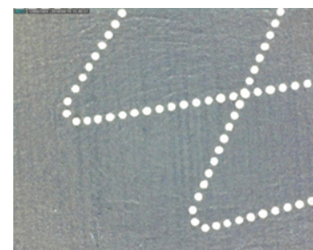
SDC 機能があるときの加工結果 (ガルバノが減速するコーナー部分でも パルス間隔を調整して加工できる)